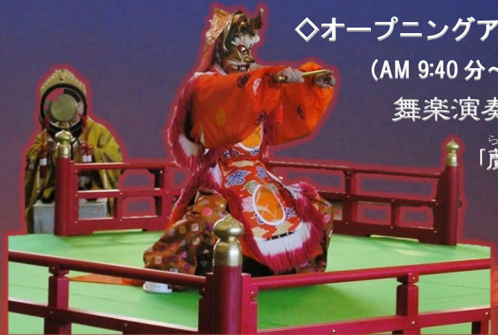
舞楽「蘭陵王」〔“競馬(くらべうま)”勝負楽〕